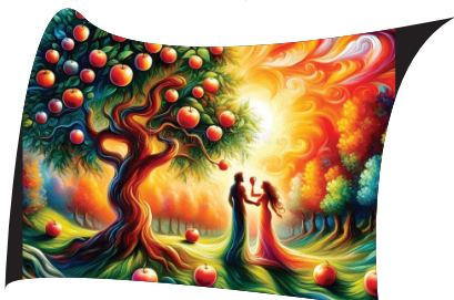
ජාතික බයිබල් තරඟාවලිය